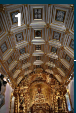
Igreja de Nossa Senhora do Bom Despacho