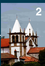
Igreja conventual de S. Salvador de Moreira