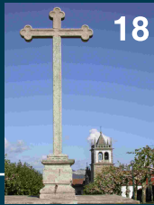
Mosteiro de Ganfei