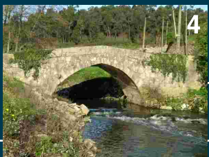
Ponte de Goimil - Custoias