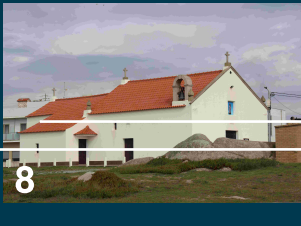
Capela de Santo André