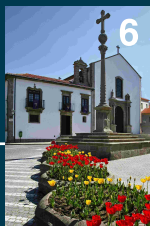
Igreja da Misericórdia de V. do Conde