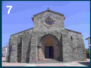
Igreja de São Pedro de Rates