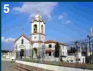
Igreja de São Tiago de Labruge