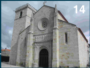
Igreja Matriz - Caminha