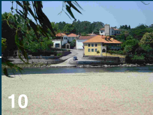
Barca do Lago-Gemeses