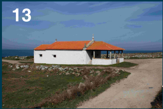
Capela de S. Isidoro - Moledo