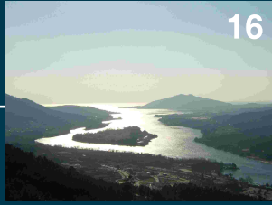
Vista do miradouro do Cervo