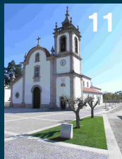
Igreja de São Tiago-Castelo do Neiva