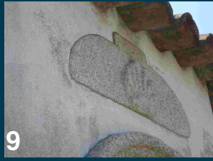
Alminhas do André-Apúlia